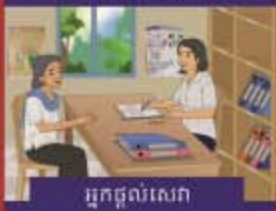
អ្នកផ្តល់សេវា