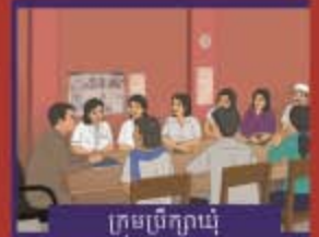
ក្រុមប្រឹក្សាឃុំ