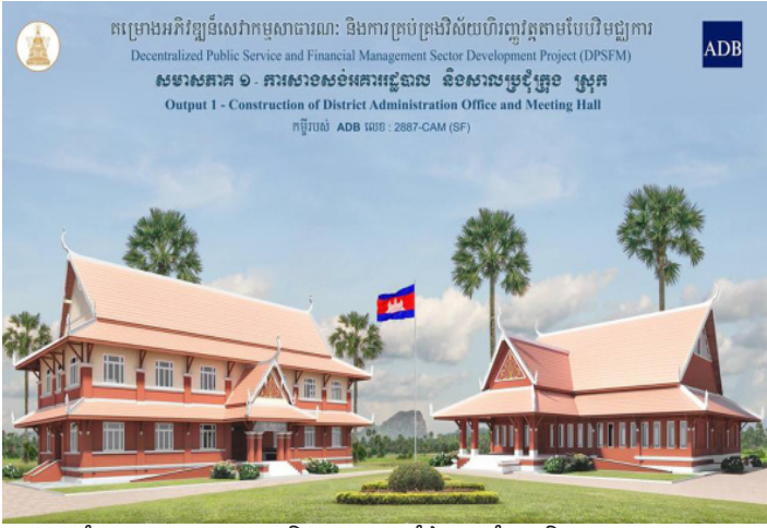
រូបភាពគំរូសាលាក្រុង ស្រុក និងសាលប្រជុំដែលគាំទ្រថវិកាដោយ ADB

ដើម្បីជួយគាំទ្រដល់រាជរដ្ឋាភិបាលក្នុងការសម្រេចនូវកម្មវិធីកំណែទម្រង់វិបល្ល័យការ និងវិសហមជ្ឈការ ធនាគារអភិវឌ្ឍន៍អាស៊ី (ADB) នៅឆ្នាំ២០១៣ បានផ្តល់ប្រាក់កម្ចីចំនួន១៣,៥ លានដុល្លារអាមេរិក ដល់រាជរដ្ឋាភិបាលក្នុងការអនុវត្តគម្រោងសេវាកម្មសាធារណៈ និងការគ្រប់គ្រងវិស័យហិរញ្ញវត្ថុតាមបែបវិបល្ល័យការ ក្នុងនោះមានថវិកាបដិភាគរបស់រាជរដ្ឋាភិបាលចំនួន១ លានដុល្លារអាមេរិក។